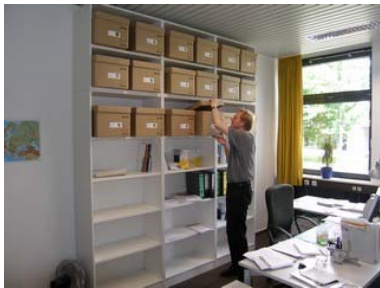
Neuer Aufbewahrungsort der schriftlichen Dokumente

Mit der personellen Änderung war auch ein Umzug von WiDuT in neue Büroräume verbunden, wo die vielen Dokumente ein neues Zuhause gefunden haben.